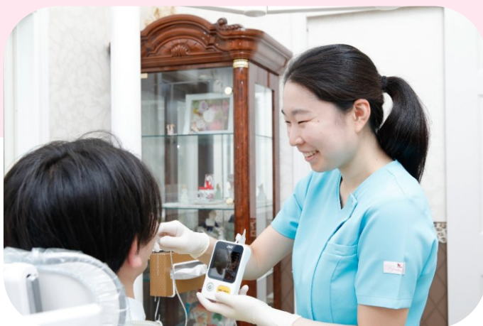
歯科用口唇筋力固定装置