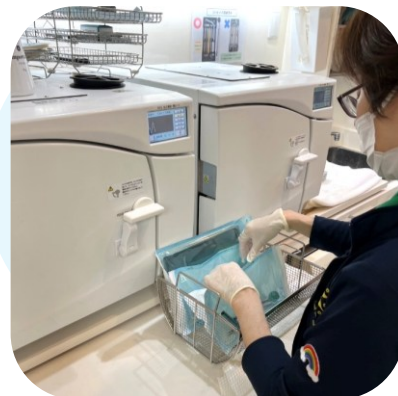
サポートスタッフの仕事風景イメージ